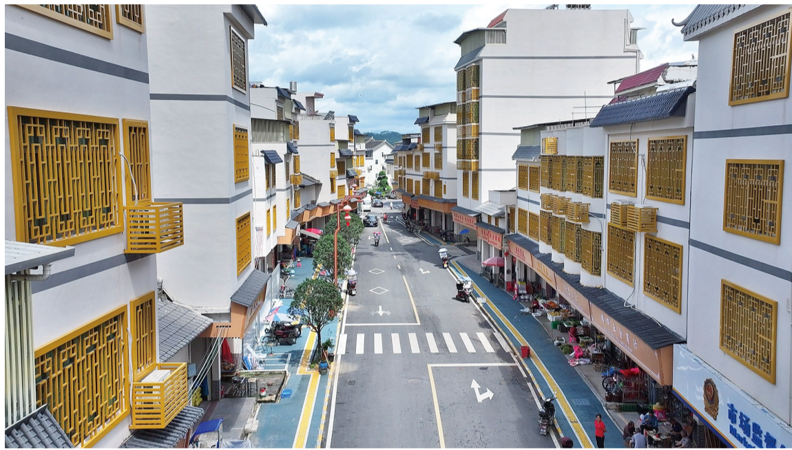
林寨镇全面提高圩镇人居环境和绿美乡村建设水平,精雕细琢绘就美丽圩镇新图景。

走进和平县林寨镇,巍峨壮观的四角楼建筑群静静矗立于此,青砖黛瓦的方形围屋棱角分明,四周绿树碧水环绕,与干净整洁的村容村貌构成一幅绝美的水墨画卷,尽显林寨镇客家风貌。