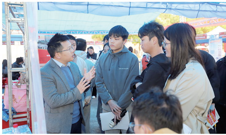
应届毕业生向企业工作人员询问岗位细节。

科以及中职、技工类院校的应届、往届毕业生前来应聘。部分中职二年级、大专二年级学生也来到现场了解岗位情况。