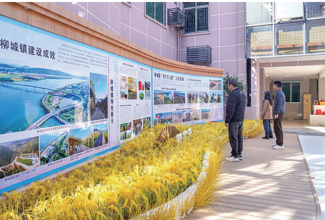
■柳城镇圩镇客厅, 集对外宣传、产品展示、咨询服务于一体。