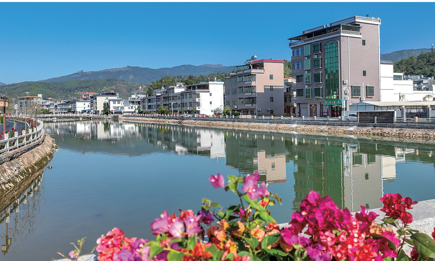
■柳城镇圩镇新貌。今年以来, 该镇以美丽圩镇“七个一”建设为抓手, 推进典型镇培育创建, 全力打造“一步一景、步步皆景”美丽圩镇。

柳城镇将以下坝“全电示范村”建设为契机, 推动农村能源革命, 以点带面加快农村地区能源清洁低碳转型, 助力“百千万工程”。下一步, 柳城将把下坝村的建设经验推广至全镇, 打造“全电示范镇”。