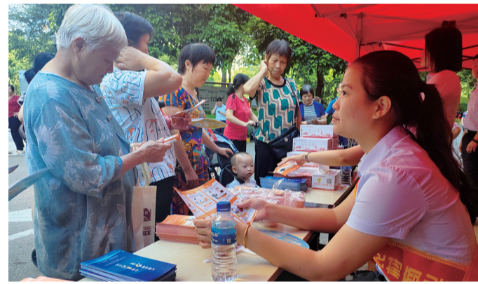
■河源农商银行工作人员倾听消费者的心声，回应消费者诉求。