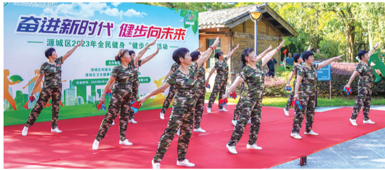
■活力四射的健身广场舞表演

主办方组织了100多名社区居民及周边市民健步在长约1000米的健康步道上。在健步过程中，市民通过观看设立于步道两侧的科普展板，学习了健身