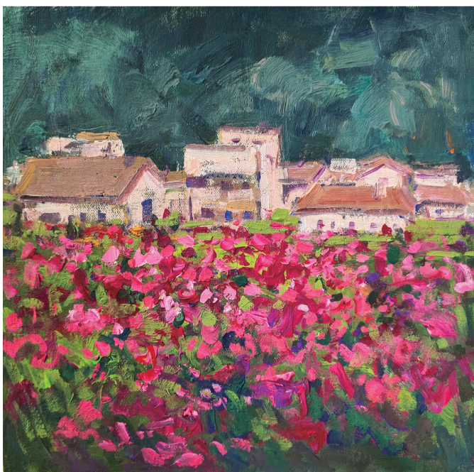
②南药基地的玫瑰园 水粉画