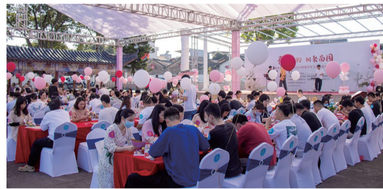
■ 160名青年欢聚一堂，奔赴一场甜蜜邂逅。

● 本报讯 记者 周慧荷 通讯员 刘飞翔 近日，由团市委主办的“青春有约 相聚南园”2023年青年交友联谊活动，在东源县仙塘镇南园古村举行，160名来自市直机关企事业单位的青年欢聚一堂，奔赴一场甜蜜邂逅。 破冰游戏、CP大闯关、心动时刻等互动活动，让青年朋友们拉近了彼此的距离。在才艺展示环节中，大家通过吉他弹唱、舞蹈表演等，将现场气氛推向了高潮。此外，活动主办方还精心设置了漫步乡村环节，青年朋友们来到南园古村特色参观点，在参观中了解美丽乡村故事，沉浸式体验生态“网红村”精品魅力，沿途还定点设置两项互动闯关游戏，进一步加深了青年男