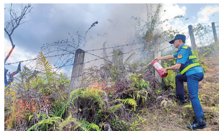
■ 路政员拎起随车灭火器翻越护栏冲上边坡灭火

我培育我践行社会主义核心价值观 ● 本报讯 记者 冯晓铭 通讯员 梁梓坤 近日，揭博高速公路一处边坡突然燃起大火，幸好路政员及时赶到现场，果断采取应急处置措施，有效控制火势，最后与紫金县消防救援大队消防员一起将火扑灭。 事发当天13时许，路政员接警后，到达现场发现着火山坡烟雾弥漫，杂草被烧得噼啪作响，大火借助风势肆意蔓延，浓烟随风飘向高速公路，时刻影响着过往车辆行驶安全。路政员立即靠边停车并做好安全围蔽，打开车载警报器，提醒过往车辆减速慢行，并拎起随车灭火器，翻越护栏冲上边坡灭火。经过近10分钟的奋力灭火，现场火势得到控制。