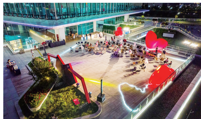
■ 高新区举办联谊活动，为单身青年搭建交友平台。

● 本报讯 记者 邓燕琴 特约记者 张立 通讯员 黄雍舒 20日晚，河源国家高新区举办单身青年联谊活动，为园区适龄单身青年搭建良好的交友平台。 夜幕下，高新区国际会议中心二楼露天平台布置温馨浪漫，50多位青年男女纷纷到场。 活动设置了破冰小游戏、一起顶气球、爱情接力赛、才艺表演等充满趣味性的小游戏，缓解了大家初相识的紧张