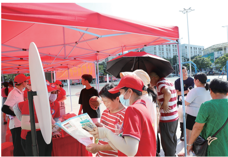
■ 参与活动的市民通过互动游戏了解垃圾分类知识

此次活动设立了知识展板、互动游戏和抽奖活动等环节，将垃圾分类的常识融入有趣的活动中，让群众了解如何进行垃圾分类。30多名高新区志愿者为群众现场讲解日常生活中容易混淆的垃圾，并向周边商户发放宣传单，普及垃圾分类知识，帮助群众了解并体验垃圾分类的良好氛围，引导辖区群众逐步养成垃圾分类投放的好习惯。 据河源国家高新区环保和城管局相关负责人介绍，高新区计划在江滩公园内建设城市生活垃圾分类主题公园，巧妙植入垃圾分类元素，通过寓教于乐、寓学于景，让市民在休闲娱乐中全面了解和掌握垃圾分类相关知识。