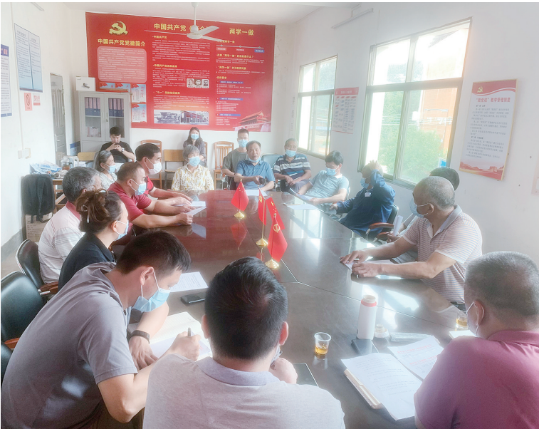
村民在道德评议会上踊跃发言，积极建言献策。

记者了解到，和一村出台了道德评议会章程，对道德评议会的性质和职责作了详细的规定。道德评议会委员由村民代表大会推选产生，负责对村民道德行为进行评议。评议会委员要求为人正直、作风正派、处理问题公正、模范遵守法律法规及村规民约等。 道德评议会评议的内容很广泛，除了好人好事、“星级文明户”外，还包括不文明陋习、缺乏见义勇为为精神等。章程明确规定：对评议的问题和现象的当事人进行讲道理、说服教育，建议其及时改正。如果连续两次评议仍未改正的，建议村委会对其予以公开曝光，限期改正；对评议出的好人好事，村委会予以公开表扬。 道德评议会章程规定，原则上每半年评议一次，由会长负责召集，步入常态化轨道。