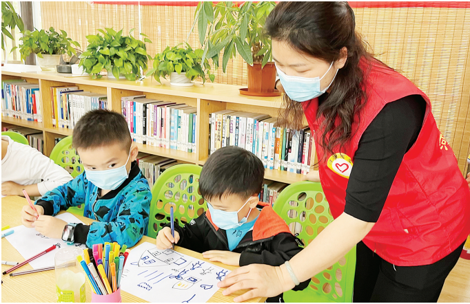
志愿者与孩子们一同参与绘画活动

“平日里，我对亲子沟通非常关注，会经常和孩子一起参加各种活动。”家长温女士表示，亲子绘画活动不仅对培养孩子勇敢、自信、乐观的品格起到非常好的作用，也让家长体会到了幸福的家庭需要用心经营，要善于倾听孩子的心声。