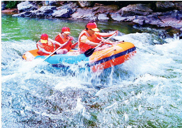
■位于和平县热水镇的热水平漂