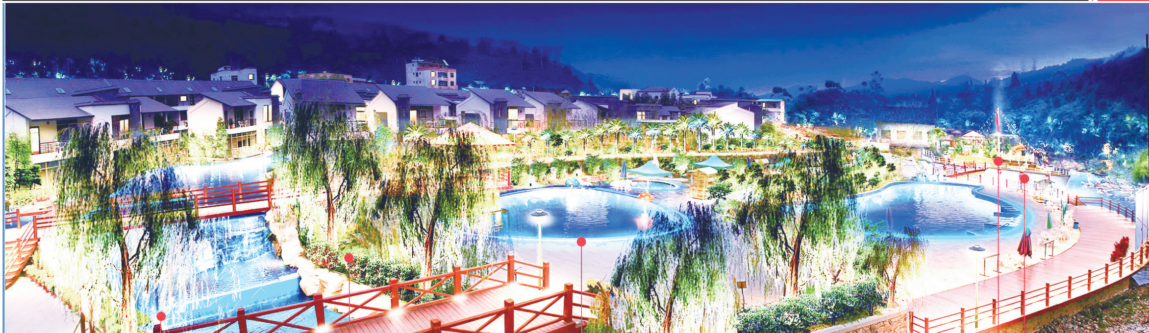
■和平县热龙温泉度假村夜景