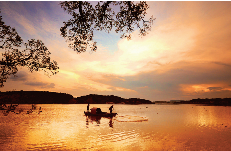
■位于和平县东水镇的东江,画境优美。

了源远流长的和平文化。 近年来,县委县政府深入贯彻党的十九大精神和习近平新时代中国特色社会主义思想,在省委、市委的坚强领导和上级业务部门的精心指导下,围绕“五大”发展理念,着力加快文旅产业发展,调整产业结构,紧紧抓住温泉资源丰富、生态环境优美、文化底蕴深厚、农业基础扎实等发展优势,大力实施“创建全域旅游示范区”战略,积极推进文旅产业发展,形势持续稳中向好。 据悉,和平县先后获得了“中国温泉之乡”“全国休闲农业与乡村旅游示范县”“中国传统村落(林寨古村)”“中国历史文化名村(林寨古村)”“全国特色景观旅游名村(林寨古村)”“广东最美古村(林寨古村)”“广东省旅游强县”等金字招牌。“温泉之都·阳明古郡”“客家四角楼”“猕猴桃南国庄园”等旅游品牌初步形成。