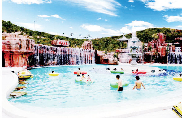
■和平县荣佳国韵温泉度假村

织内发挥作用。 和平县10处温泉分布于7个镇,共42个泉眼,资源总量非常丰富,常年喷涌水量超过250万立方米,自然分布合理,分别是热水镇南湖温泉、大坝镇汤湖坝温泉、公白镇新聚温泉、贝墩镇的贝墩温泉群(由贝溪温泉、强新温泉和三多温泉组成)、东水镇长热温泉长塘暖水温泉、长塘中暖温泉、彭寨滚水河温泉。