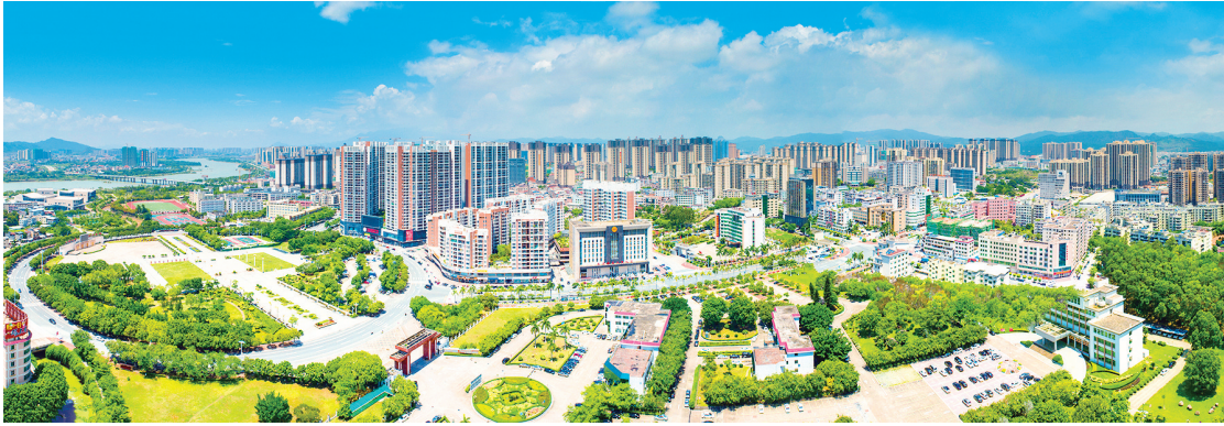
■随着一大批市政基础设施项目和商业综合体项目落户东源县城建设,河源滨江新城区初具规模,已成为一座广大人民群众宜居宜业的幸福名城。

■本报记者 李成东 ■特约记者 李远来 蓝天明 ■通讯员 张小龙 薛宇航 廖伟健