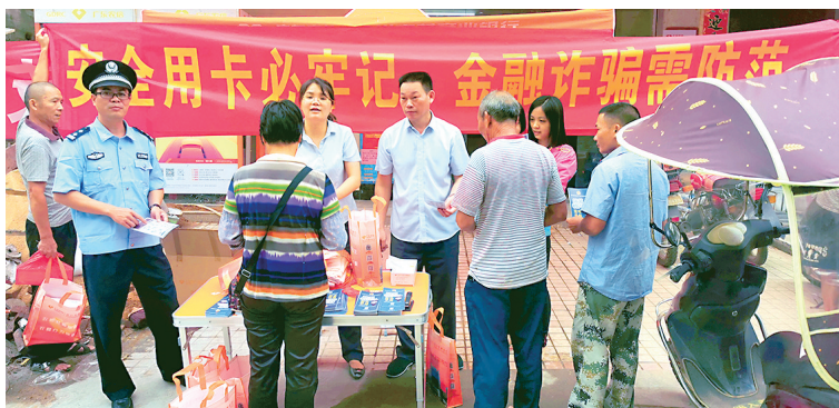
■龙川农商银行工作人员向群众宣传防范电信网络诈骗知识